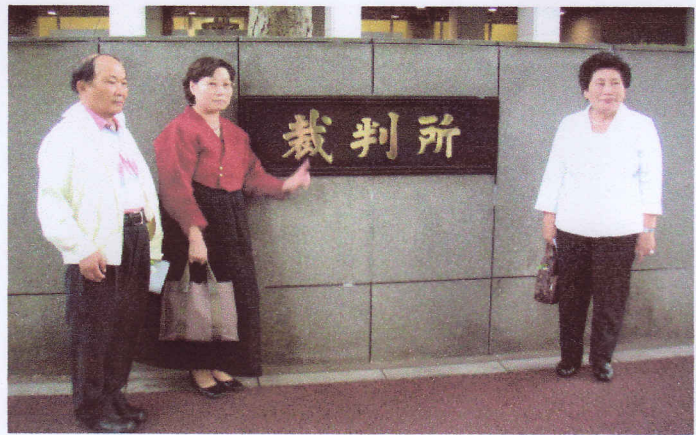
9月7日の第1回口頭弁論に参加した原告団のみなさん